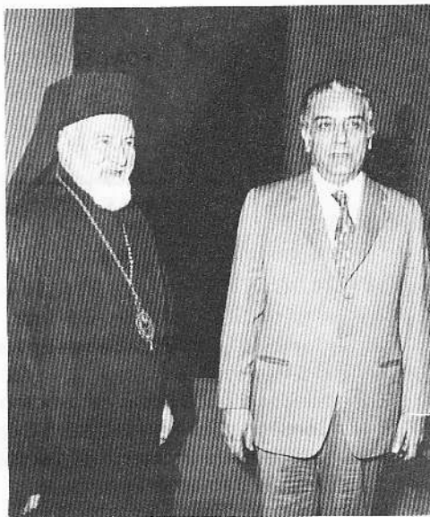
S. B. Maximos V avec Son Exc. Mr Elias Sarkis, Président de la République Libanaise.