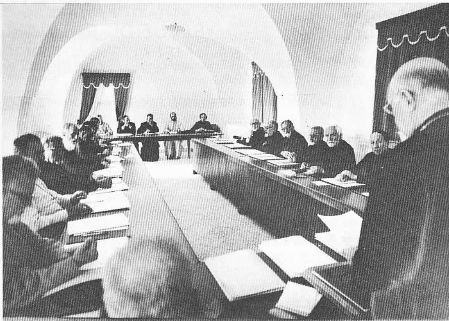
Ouverture du Synode à Aïn Traz, le 21 août 1979

En ce Nouvel An liturgique, que nous célébrons aujourd'hui, nos pensées se portent tout naturellement vers le Seigneur et la Théotokos à qui, dans nos belles prières liturgiques, nous venons de confier « tout le tour », la « couronne » de l'année !