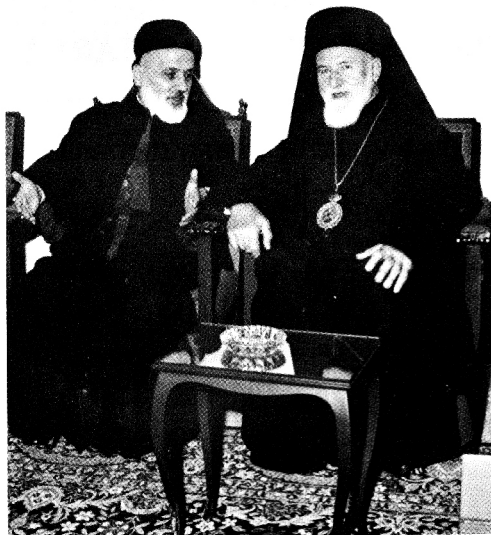
Côte à côte les Patriarches Sfeir et Hakim