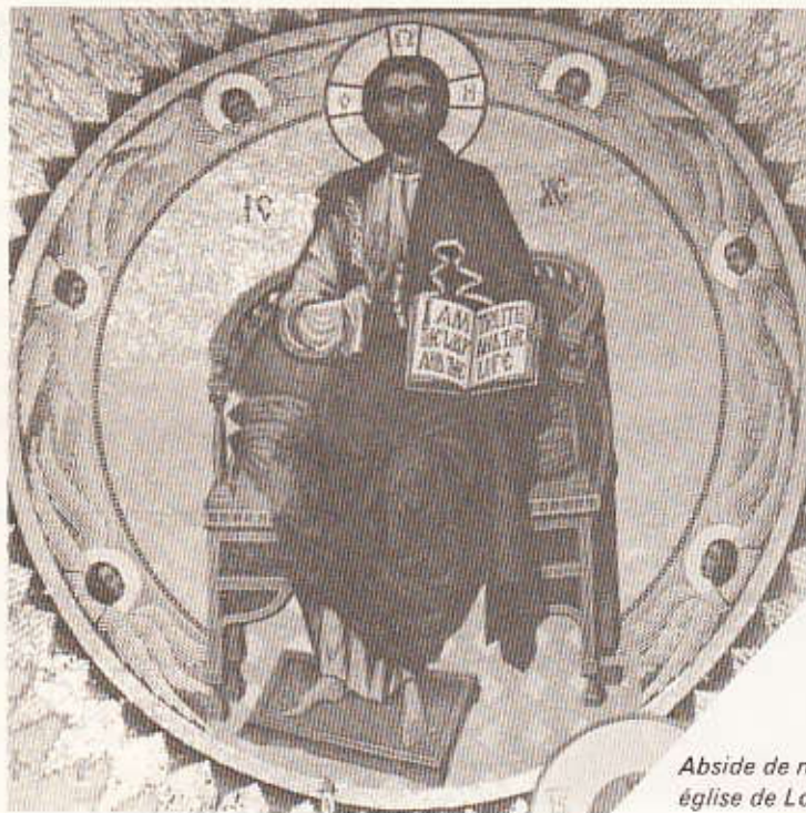
Abside de notre église de Los Angeles.