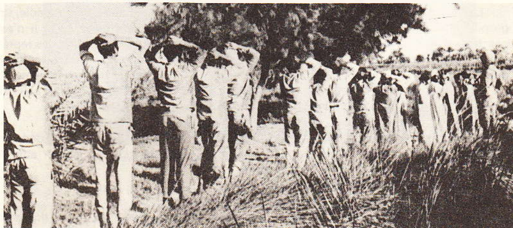
Le respect de l'homme !...

Colonne de prisonniers égyptiens (25/10/73)